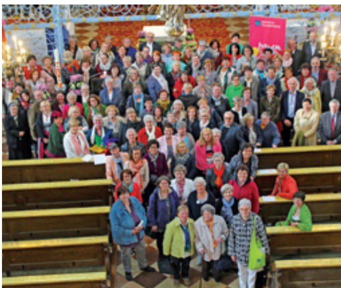
70-Jahr Feier in Maria Plain

„Mystik und Widerstand“ als „Aufgabe der Stunde“