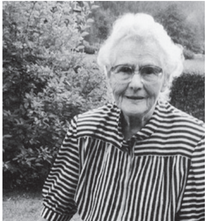
Maria Mayr © kbF Archiv

Eine gleichzeitige innerdiözesane Umstrukturierung brachte eine inhaltliche Umorientierung durch die Neugründung des Frauenreferats und der Frauenkommission im Jahr 2000. Finanzielle Umschichtungen und solche im Personalbereich erzwangen nun einerseits eine noch stärkere ehrenamtliche Ausrichtung der kfb. Andererseits wurden die freiwerdenden diözesanen Ressourcen für eine offene Frauenarbeit eingesetzt. Die möglicherweise als Konkurrenz verstandene Erweiterung der diözesanen Frauenarbeit führte zu sehr fruchtbaren Kooperationen mit Meilensteinen in der kirchlichen Frauenarbeit, die allein nicht denkbar gewesen wären. Die Herausgabe der Liturgiemappe: „Frauenlebenswenden in Liturgien, Ritualen und Feiern“ mit bischöflicher Approbation – gemeinsam mit der Frauenkommission und dem Frauenreferat – ist da beispielhaft zu nennen. Im Projekt „hei-