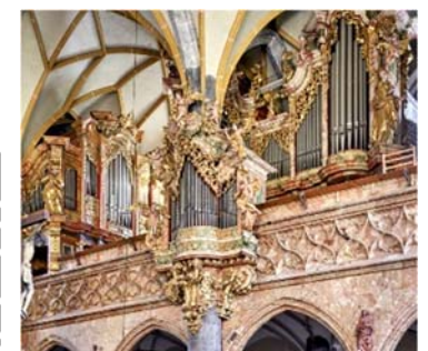
Liste der Register

Die Patinnen und Paten werden auf einer Tafel am Orgelgehäuse verzeichnet!