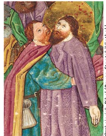
Ottotheinrich-Bibel (Bayer. Staatsbibliothek)