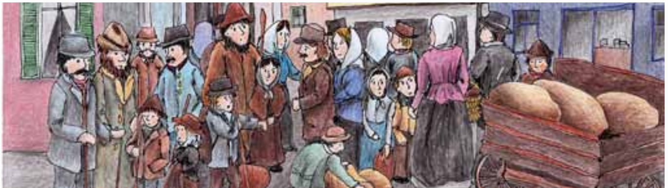
Illustration aus dem Kinderbuch „Abschied von den Bergen“: „Kindermarkt“ in Friedrichshafen, einer Darstellung aus Ravensburg nachempfunden.

Auch wir waren Heimatsuchende und Flüchtlingskinder