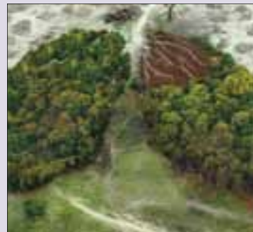
Thema Amazonien-Synode Seite 8/9