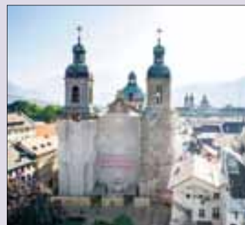
Aufgezeigt Kunst: Weltgestalten Seite 11