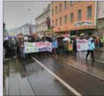
Engagement Make the world GRETA again Seite 5