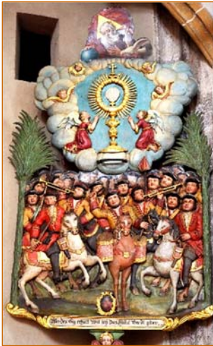
barocke Holzstandarte beritten mit alter Uniform

Im Frühling beginnt wieder die Zeit der Prozessionen. Dem aufmerksamen Betrachter der Prozessionen in Schwaz fallen zwei Besonderheiten im Vergleich zu anderen Orten Tirols auf: die Lahnbachprozession, die es so nur in Schwaz gibt sowie die Begleitung des Allerheiligsten von Männern in historischer Ausrüstung unmittelbar beim Traghimmel.