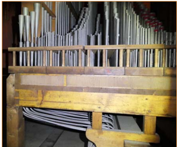
Blick in ein Seitenwerk

Nach 55 Jahren ist die Elektrik und die Spieltechnik (Luftversorgung, Membrane, ...) überholt und muss komplett erneuert werden.