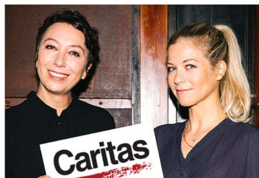
Ursula Strauss und Hilde Dalik